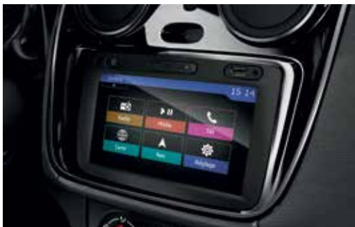
MEDIA NAV cu ecran tactil de 7"

Așa că, Lodgy îți propune, opțional, MEDIA NAV, un sistem multimedia intuitiv și ușor de utilizat, integrat în consola centrală, cu un ecran tactil de 7", care include radio, Bluetooth® și navigație. Cu sistemul multimedia ce echipează Lodgy poți să ascuți muzica preferată prin audiostreaming, dar ai la îndemână și folosirea telefonului mobil handsfree. Și pentru că trebuie să fii în locul potrivit, la momentul potrivit, te poți baza pe funcția de navigație, cu afișaj 2D sau 3D. În plus, ai satelit de comandă pe volan și prize Jack și USB.