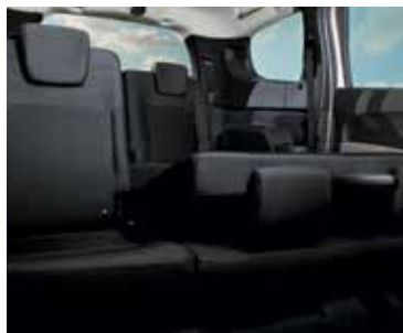
În funcție de versiune, bancheta de pe rândul al doilea este fracționabilă 1/3 - 2/3