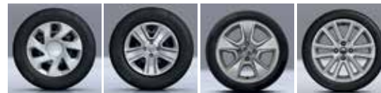
GROOMY 15" POPSTER 15" NEPTA 15" ALTICA 16"