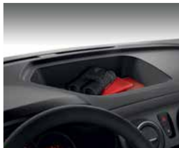
Spațiu de depozitare situat în partea superioară a planșei de bord