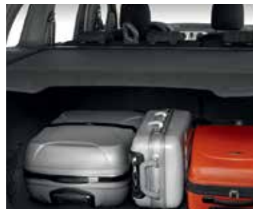
Tabletă portbagaj tip înfășurător