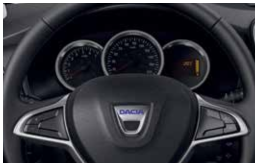
Volan Soft Feel cu 4 brațe